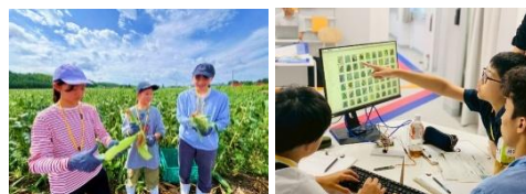
まるっと探究 2025 夏プログラムの様子。画像左は食と農編 in 北海道。右はビジネス創造編 in 東京。