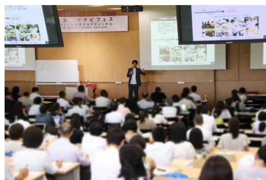
大きな会場も満員御礼(2018)