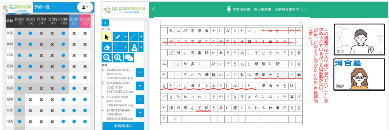
▲ 指導日時はWebで予約します

授業はオンライン個別指導形式で行います。受講生が自由に日時・講師を選択して予約できるため、部活や学校行事などで忙しい中でも自分の都合に合わせて指導を受けられます。