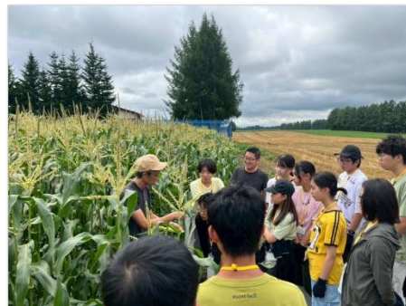
昨年のツアーの様子。食と農をテーマに北海道・十勝で探究。生産者の情熱や工夫を感じる場となった。

「まるっと探究」は、河合塾グループが2025年春から始めた探究学習のシリーズです。教室や塾といった日常生活から、地域や社会に飛び込み、五感をフル稼働させて現実世界が抱える多様な課題を体感し、解決策を考えます。自らの足で専門家や研究者、企業や地域で活躍されている人々を訪ねて話を聞き、一つの事象を多角的に捉え、本質に迫ると同時に、多様な背景を持つ異学年の仲間と寝食を共にする、今までとは異なるコミュニティの形成も体験。これらは、河合塾グループが2027年4月に岩手県に開校を予定する「通信制×全寮制×地域での探究学習」が特長のドルトン×学園高等学校*の学びを先取りするものであり、私たちが考える新しい学びのカタチを実践するものです。 *認可申請準備中